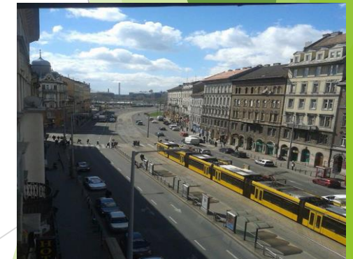
Budapest IX. kerület Ferencváros komplex szociális és intézményi hatásvizsgálat