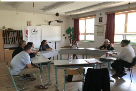
Fókuszcsoport, digitális köznevelési fejlesztési projekt ,Nyírparasznya