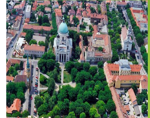
Cegléd város szociális térkép