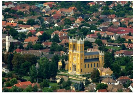
Fót város szociális térkép